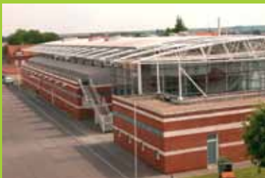
Le Théâtre du Jeu de Paume