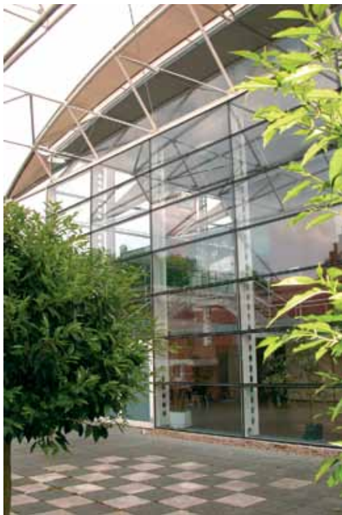
Le Théâtre du Jeu de Paume

Vous pouvez recevoir notre info culture en nous communiquant votre adresse mail :